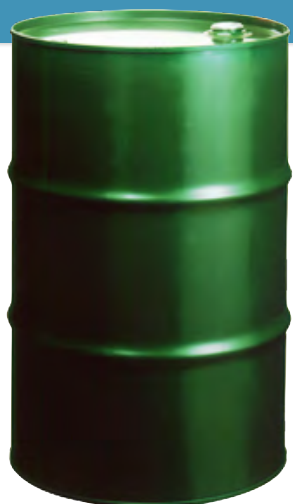
鋼製ドラム (クローズドタイプ)