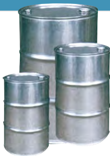
ステンレス ドラム