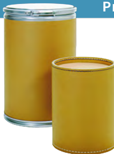
ファイバー ドラム