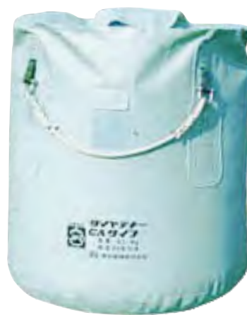
フレキシブル コンテナ