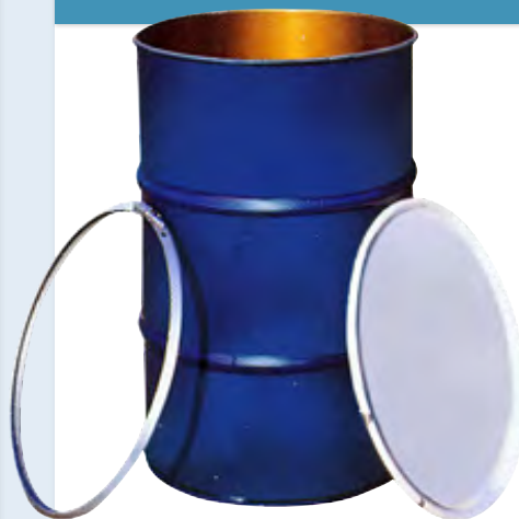
鋼製ドラム (オープンタイプ)