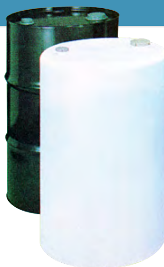
ケミドラム (ポリエチレン内装)