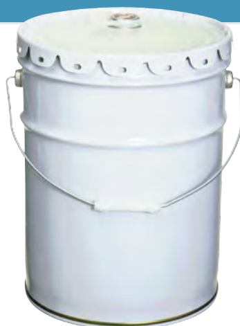
ペール缶 / 小型